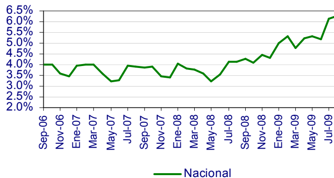
Tasa de Desocupación

* En el mes que se reporta, la Tasa de Desocupación (TD) a escala nacional fue de 5.90% de la PEA, porcentaje superior en 2.13 puntos al registrado en el mismo mes de 2008, mientras que cifras desestacionalizadas muestran que la TD tuvo un aumento de 0.19 puntos porcentuales respecto a la del mes inmediato anterior.