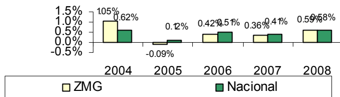
Inflación mensual durante agosto